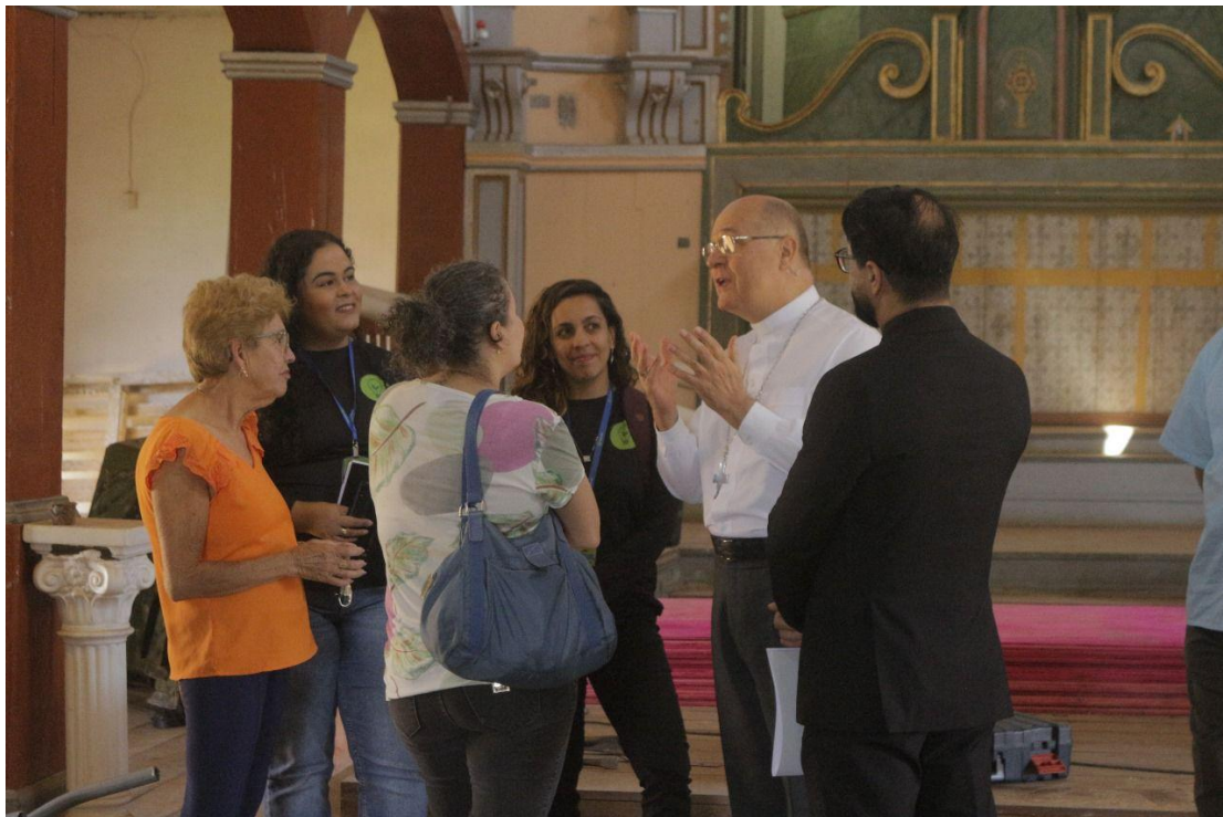
Equipes da Mitra de Diamantina, Plataforma Semente, IPHAN e Paróquia Data: 21/05/2024