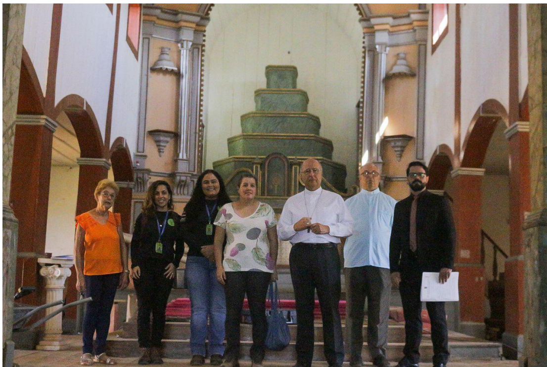
Equipes da Mitra de Diamantina, Plataforma Semente, IPHAN e Paróquia Autoria: Mitra Arquidiocesana de Diamantina Data: 21/05/2024