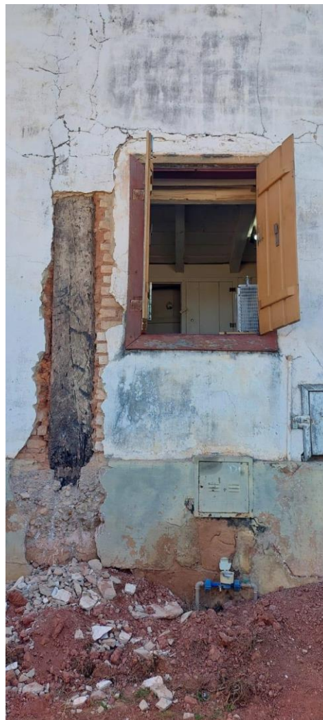
Detalhe da estrutura de madeira e alvenaria de tijolos maciços em estado precário Data: 21/05/2024