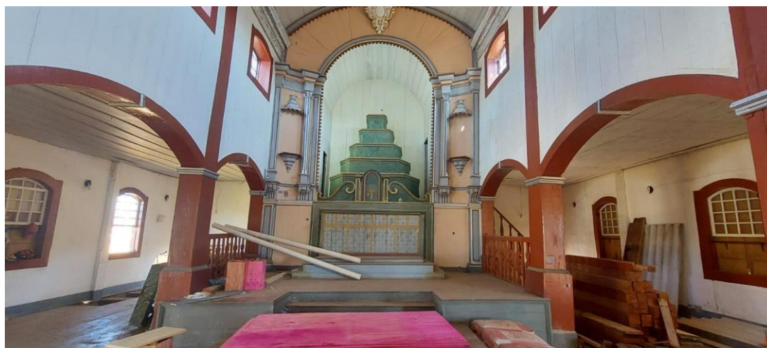
Altar mor Data: 21/05/2024