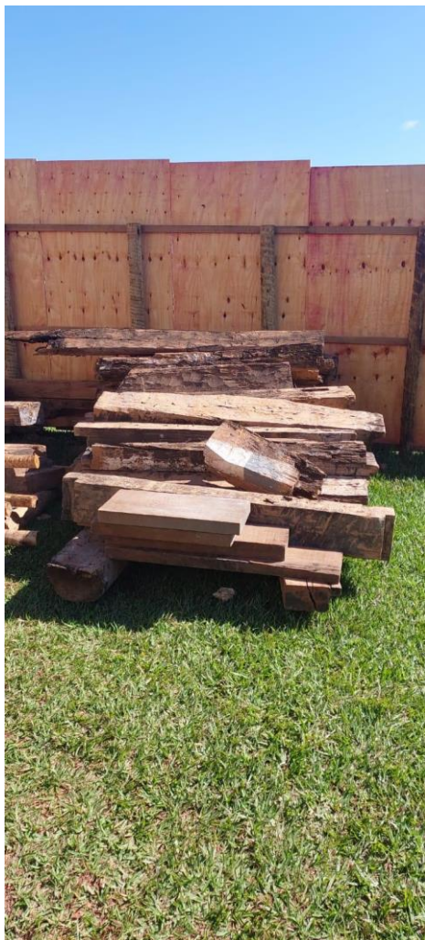
Madeiramento que será utilizado na obra Data: 21/05/2024