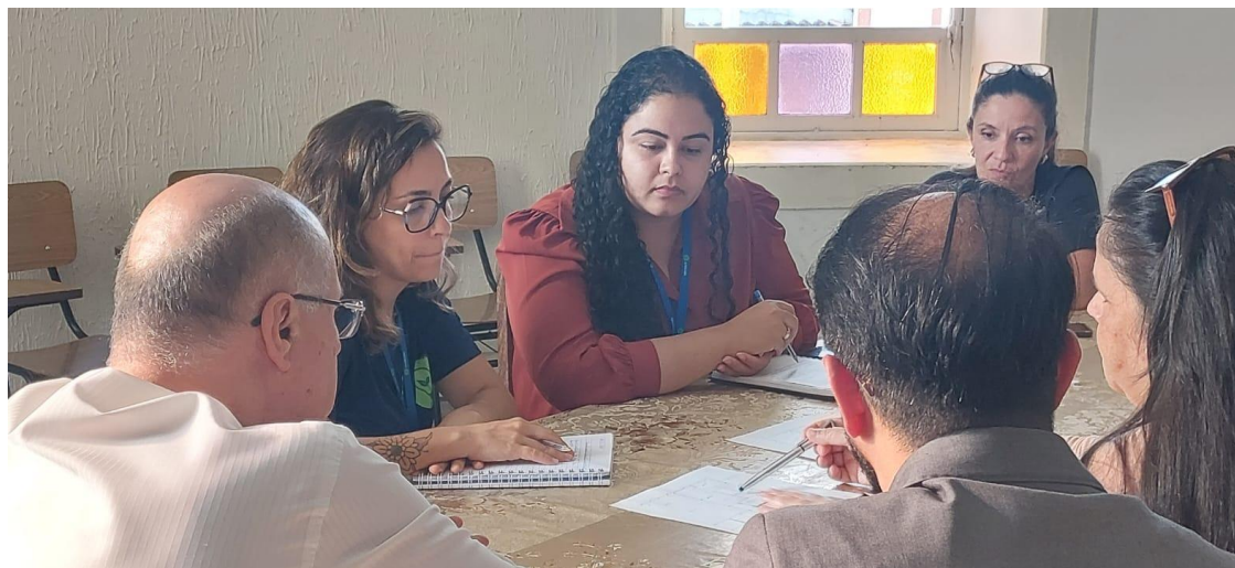
Reunião entre as equipes para alinhamentos do projeto Autoria: Maria Letícia Ticle Data: 20/05/2024

alteração significativa do escopo do projeto aprovado pela Plataforma após sua contemplação, com as justificativas técnicas embasadas por Nota Técnica do IPHAN e as respectivas aprovações pela equipe multidisciplinar do Semente.