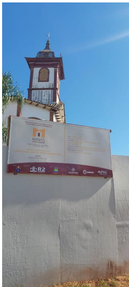
Tapume e placa da obra Autoria: Maria Letícia Ticle Data: 21/05/2024