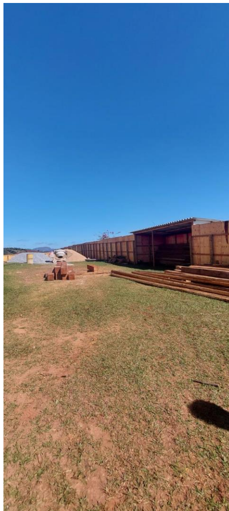
Madeiramento que será utilizado na obra Autoria: Maria Letícia Ticle Data: 21/05/2024

Abaixo, seguem listadas as atividades previstas para execução e respectivas situações no momento da visita técnica: