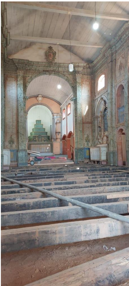
Piso de madeira removido Data: 21/05/2024