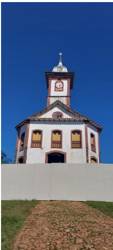
Tapume instalado no entorno da edificação Data: 21/05/2024

No adro da igreja estavam parte das peças de madeira que serão utilizadas na execução da obra, material de dimensões específicas e fora dos padrões comerciais, vindo do Pará e outras localidades. Roberta atestou a qualidade do material e compatibilidade com as ações que estão sendo empreendidas.