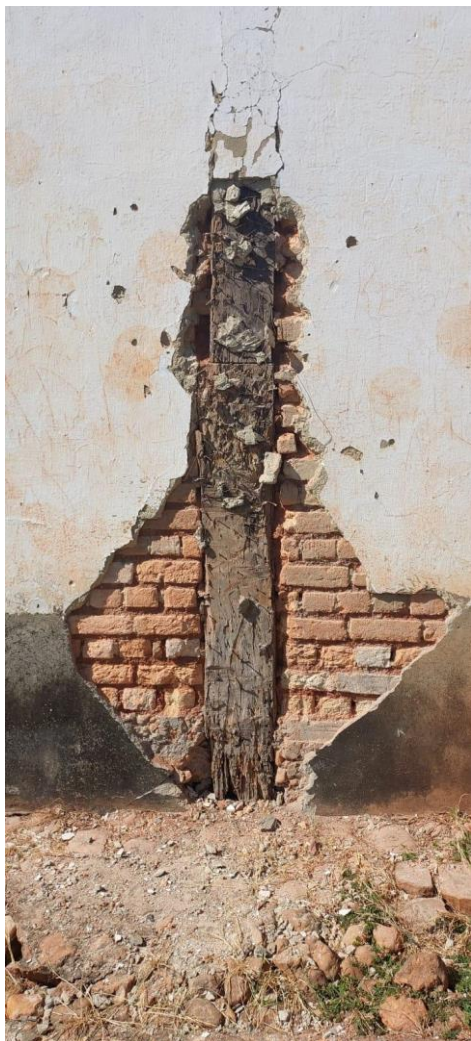
Detalhe da estrutura de madeira e alvenaria de tijolos maciços em estado precário Data: 21/05/2024