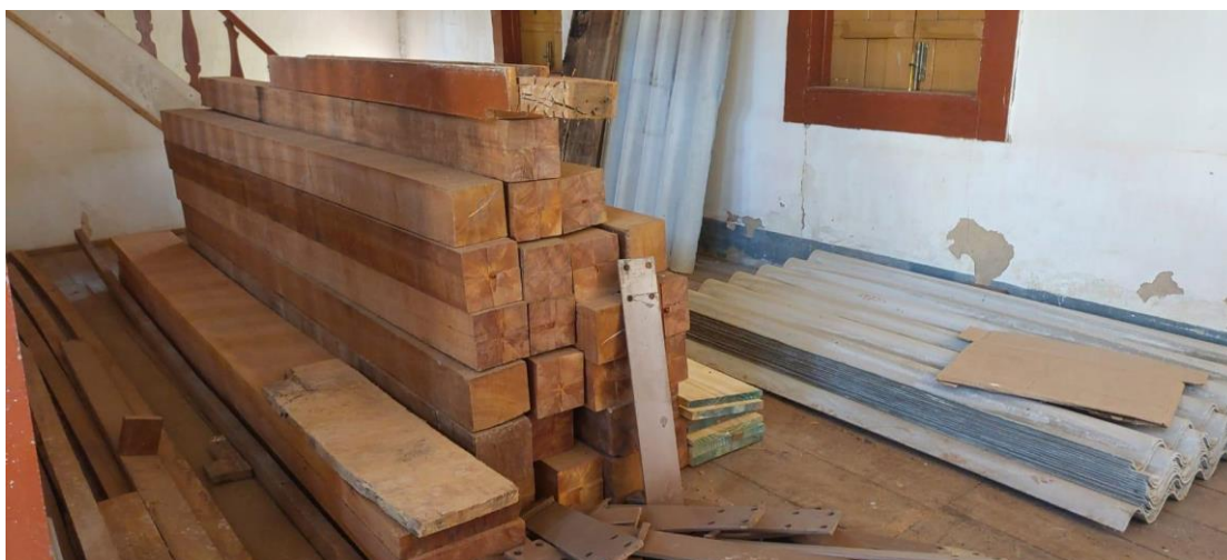
Madeiramento a ser utilizado no restauro da igreja Autoria: Maria Letícia Ticle Data: 21/05/2024