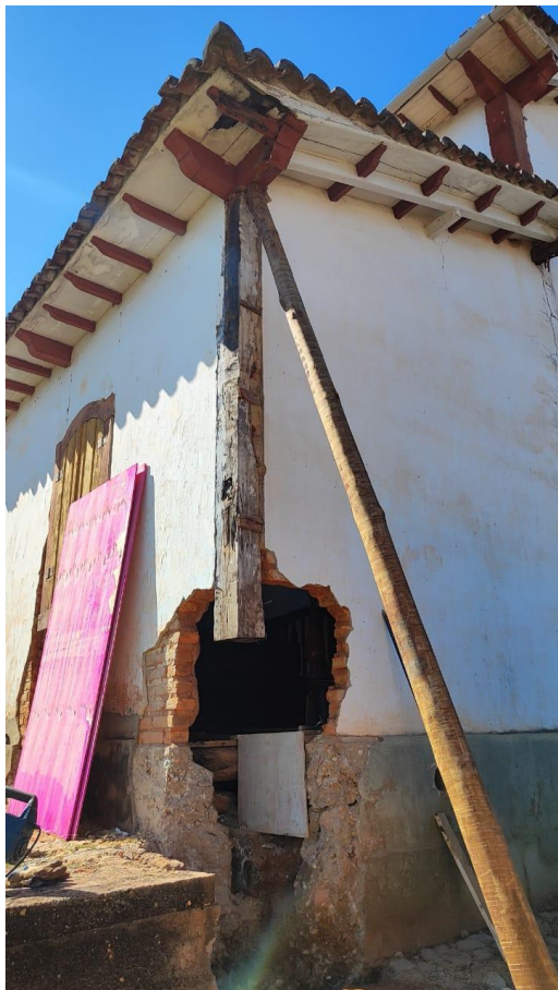
Detalhe da estrutura de madeira comprometida Data: 21/05/2024